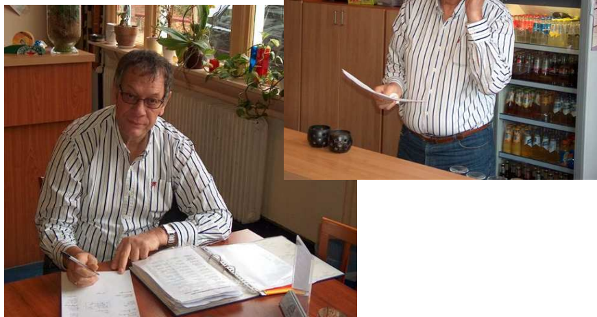
Beheerder aan het werk

DOEL 3: Een stabiel en kwalitatief goed beheer voor wijkaccommodaties om deze nog beter te kunnen benutten en effectiever in te zetten voor beleidsdoelstellingen zoals die van de WMO.